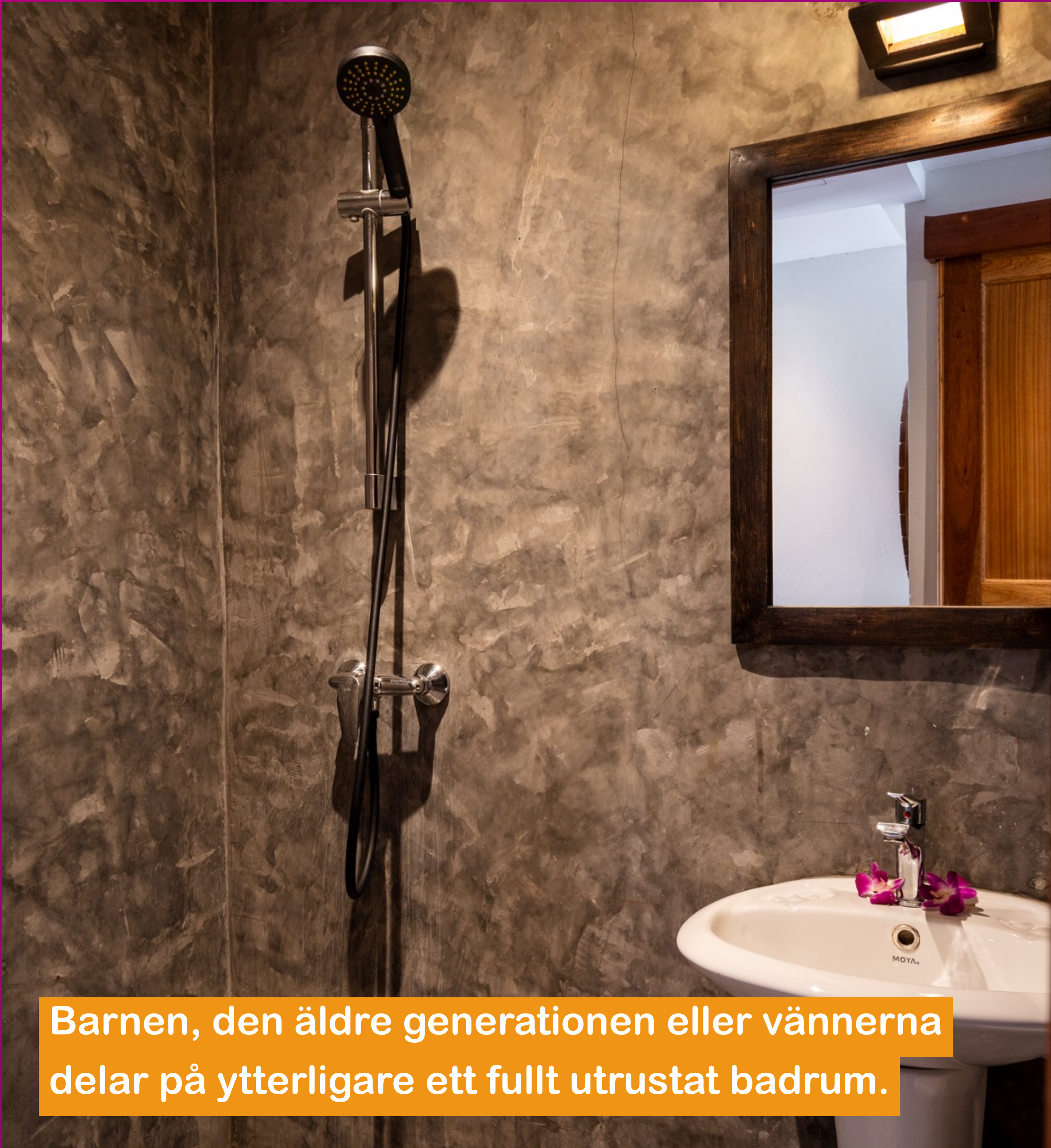
Barnen, den äldre generationen eller vännerna delar på ytterligare ett fullt utrustat badrum.